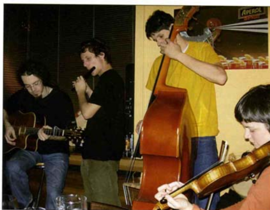
Weitum bekannt: die Pustertaler Folkband „Landor“.

Handwerkerzone 9 - 39030 Tarenten Tel.: 0472 545178 Mobil: 347 7129031 e-mail: hochbau@klapfer.com